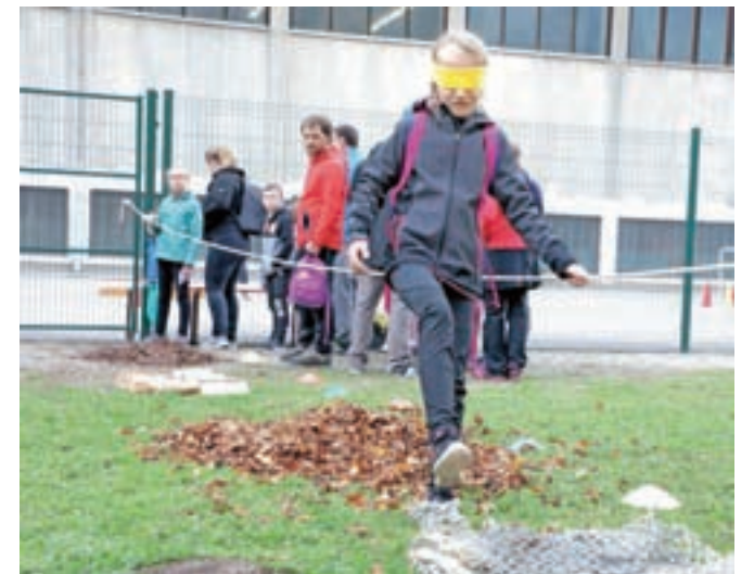
Vznemirljiva hoja po listju z zavezanimi očmi

Jesensko športno prireditev za učence so tokrat pripravili že četrto leto zapored, v prejšnjih letih so se jim pridružili tudi starši, osnovni namen jesenskega gibalnega društva pa je prav skupaj preživeti čas, naučiti se sodelovanja in se pri tem zabavati. "Pravkar začenjamo za našo šolo jubilejno, šestdeseto