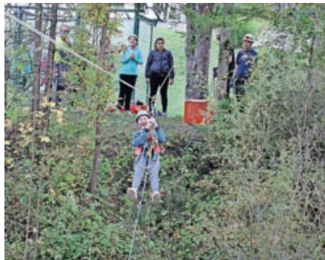
Užitek ob drznem spustu po jeklenici

li ni bila in tudi ne bo plačljiva, še poudari Alenka Cuder. Na prireditvi Gibanje z razlogom so se učenci udeležili različnih delavnic, od veslaške, likovne in ritmično-plešne do orientacijske, lokostrelske in jamarške. Uživali so v igrah z žogo, spustu po jeklenici in hoji po listju z zavezanimi očmi. Učenci z Podružnične šole Ovsiške pa