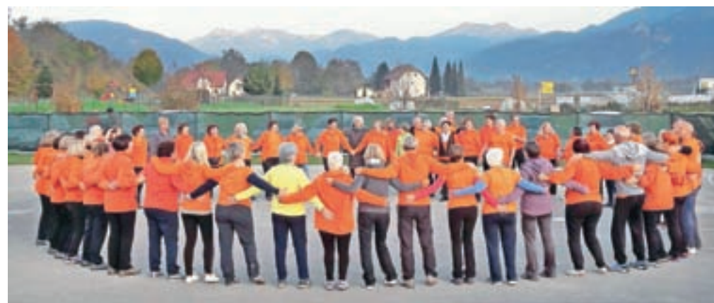
Na igrišču Vrtca Lesce je tokrat telovadilo kar 64 telovadk in telovadcev.