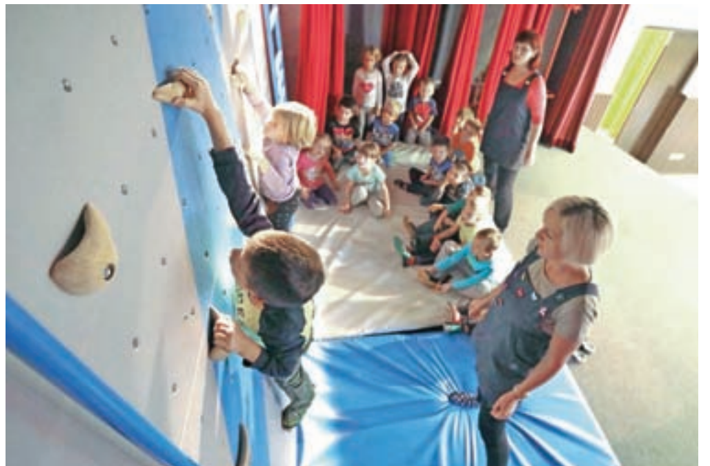
Otroci v teh jesenskih dneh pod nadzorom vzgojiteljic že uživajo v plezanju po novi plezalni steni.

Priložnost so izkoristili tudi za slovesnost ob zamenjavi strešne kritine na stavbi Doma krajanov, v kateri so