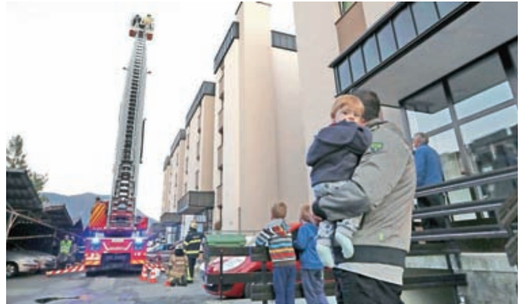
Posebej težko je bilo v ozkem prehodu upravljati gasilsko lestev.