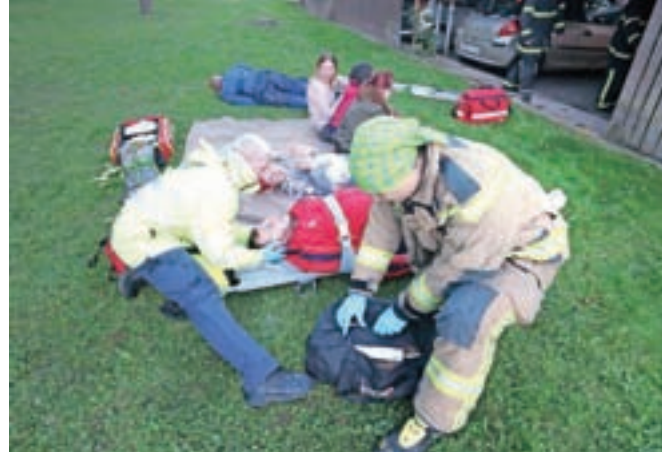
Del vaje je tudi oskrba ponesrečenih.

"Namen vaje je bil preveriti intervencijske poti na Grad-