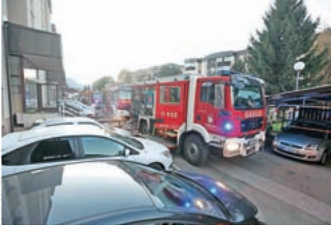
Dostop med prehodi je zaradi nadstreškov zelo otežen.

Radovljiški gasilci so v oktobru, mesecu požarne varnosti, pripravili gasilsko vajo, s katero so želeli preveriti, kako bi v primeru požara lahko posredovali v gosto naseljeni blokovski soseski na Gradnikovi ulici v Radovljici.